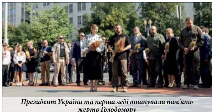
Президент України та перша леді вшанували пам'ять жертв Голодомору

У Вашингтоні завершилася зустріч глав держав і глав урядів 32 членів НАТО, їхніх країн-партнерів і Європейського Союзу, яка відбувалася упродовж 9–11 липня. Саміт був присвячений 75-річчю НАТО. Захід став четвертим самітом НАТО, який відбувся у Сполучених Штатах і першим самітом після вступу Швеції до НАТО. Серед ключових тем саміту – захист Альянсу на тлі російської агресії в Україні, колективна оборона, військова присутність на східному фланзі НАТО та ядерне стримування.