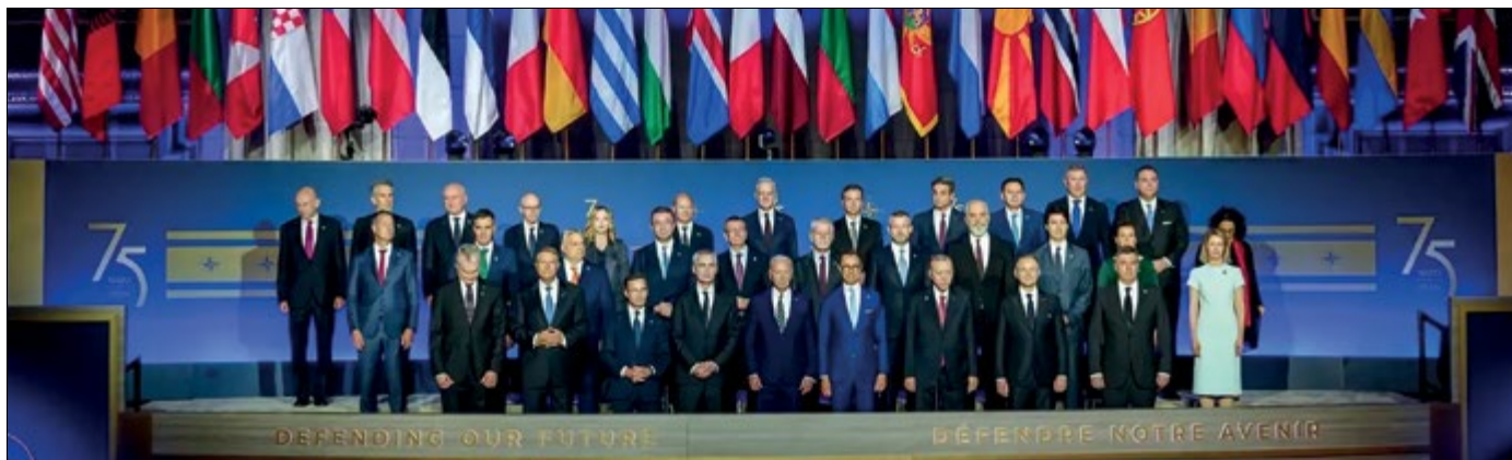
Учасники саміту НАТО у Вашингтоні